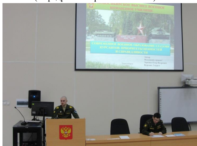
Пленарное заседание конференции.