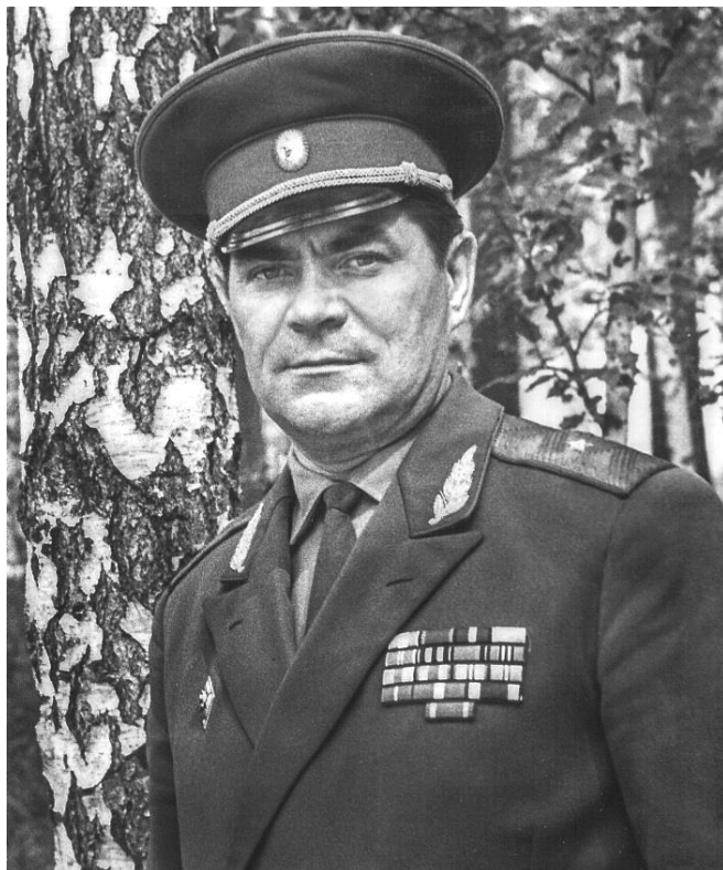
Первый начальник училища генерал-майор Василий Георгиевич Зибарев. Таким он запомнился многим офицерам и курсантам училища.

В 1949 г. В.Г. Зибарев заочно окончил Военно-политическую академию им. В.И. Ленина. Дальнейшую службу он проходил на различных военно-политических должностях (от пропагандиста политотдела дивизии до первого заместителя начальника политотдела армии). С должности первого заместителя начальника политотдела 14-й армии Одесского военного округа он и вступил в командование формирующимся Новосибирским высшим военно-политическим общевоинским училищем.