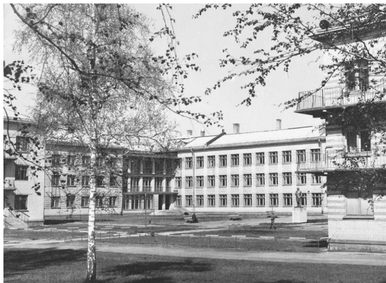
Учебный корпус №1. В этом здании первоначально располагалось практически все училище

Вечерний Академгородок того времени, особенно микрорайон «Щ», первоначально вызывал у нас противоречивое чувство. Нам запомнилось немного: деревянный домик с понятной, но странной вывеской «ст. Сеятель», овраг, через который мы пробирались строем и почти единственная улица Солнечногорская (ныне ул. Иванова) с десятком одно и двухэтажных брусчатых домов, изредка стоявших на ее противоположных сторонах. Жилая зона по правой стороне заканчивалась лыжной базой и конечной остановкой автобуса № 109 (на территории современной школы № 190). Поневолу вспоминалось предостережение пессимистов о том, что «там (в Новосибирске) еще по ночам медведи по улицам бродят». Окончание левой стороны улицы было, по сути, городским, и это нас несколько взбодрило. Здесь находились благоустроенный по тем временам корпус и четыре пятиэтажных панельных дома. К нашему величайшему удовлетворению лучшее из увиденного и являлось нашим училищем, расквартированным в здании физико-математической школы-интерната Сибирского отделения Академии наук СССР (сейчас учебный корпус № 1).