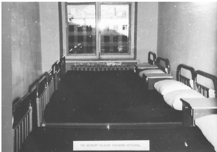
Спальное помещение одного из курсантских подразделений (1967 г.)