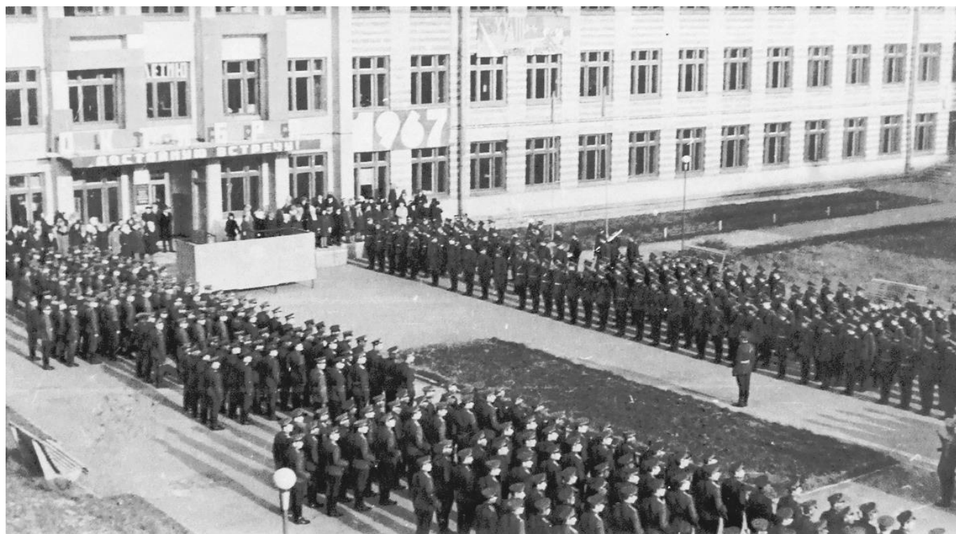
1 сентября 1967 г. Митинг, посвященный началу первого учебного года